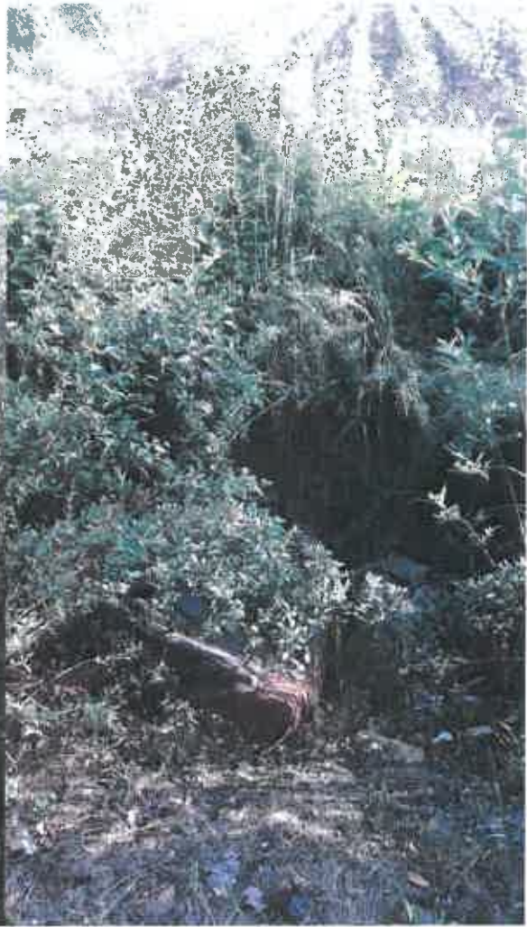
Kanapa i śmieci w rowie